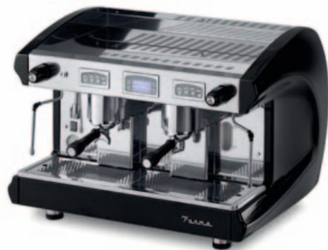
SAE2 DSP BLACK