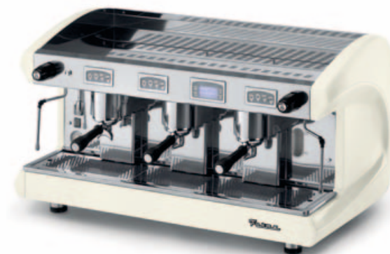
SAE3 DSP WHITE