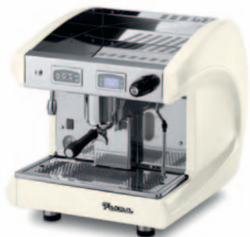
SAE1 DSP WHITE