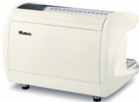
BACK2 FULL WHITE