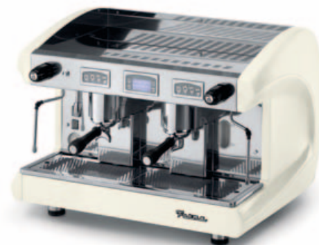
SAE2 DSP WHITE